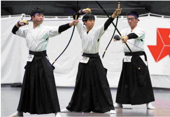
男子団体 第2位 鹿児島工業高等学校