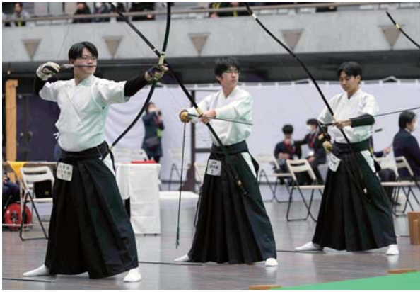
男子団体 優勝 山形県立山形中央高等学校