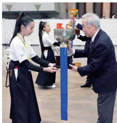
優勝杯返還 祐誠高等学校