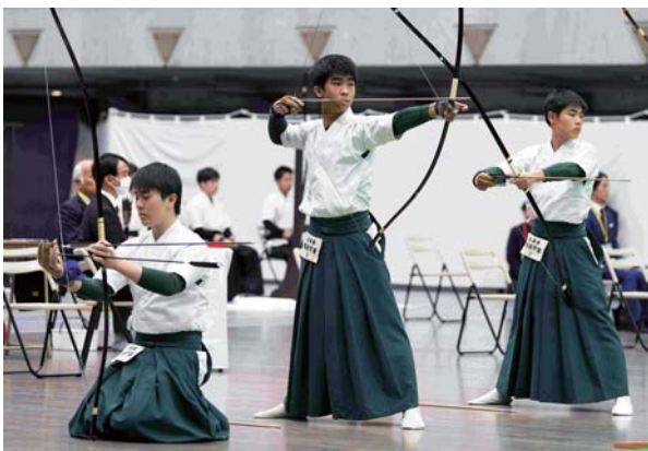
男子団体 第3位 報徳学園高等学校