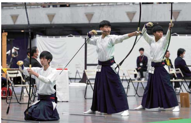
男子団体 技能優秀賞 慶應義塾高等学校