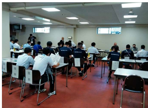
③全国専門委員長会議(8月2日(水)) 札幌市南区体育館)