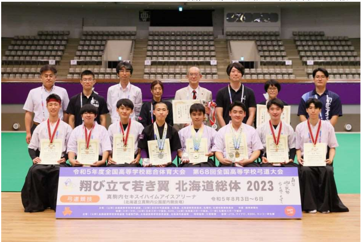
第8位 第6位 第4位 準優勝 優勝 第3位 第5位 第7位