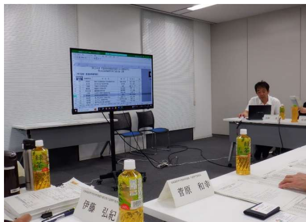
②全体会議(8月1日(火)) 真駒内セキスイハイムアイスアリーナ特設会議室)