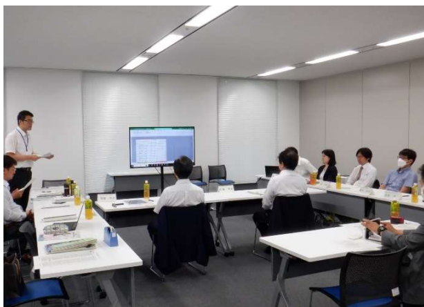
①立順抽選会(7月1日(土)) 札幌市実行委員会 会議室)