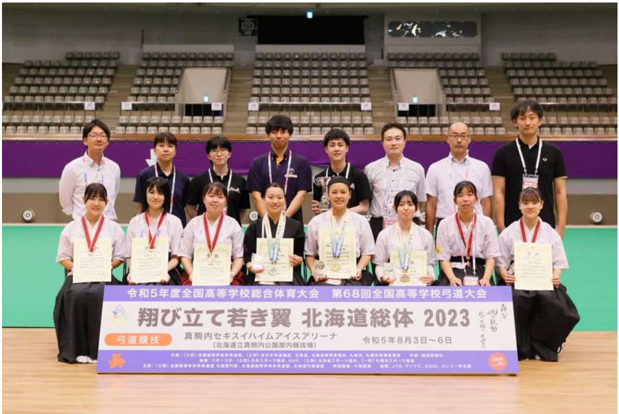
第8位 第6位 第4位 準優勝 優勝 第3位 第5位 第7位