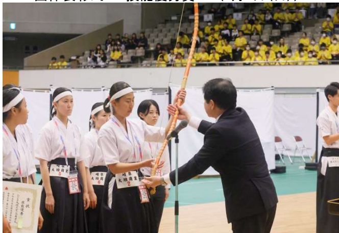
女子 岐阜県立大垣商業高等学校(岐阜県)