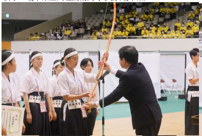
男子 岩手県立黒沢尻工業高等学校(岩手県)