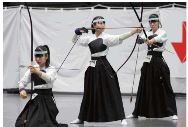
女子団体 第3位 作新学院高等学校