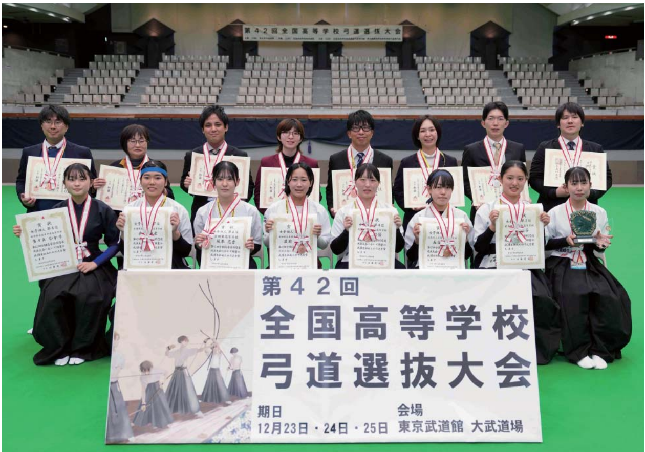
女子個人 入賞者 第8位 第7位 第6位 第5位 第4位 第3位 第2位 優勝