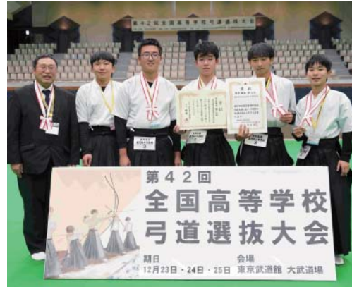
男子団体 第2位 鹿児島工業高等学校