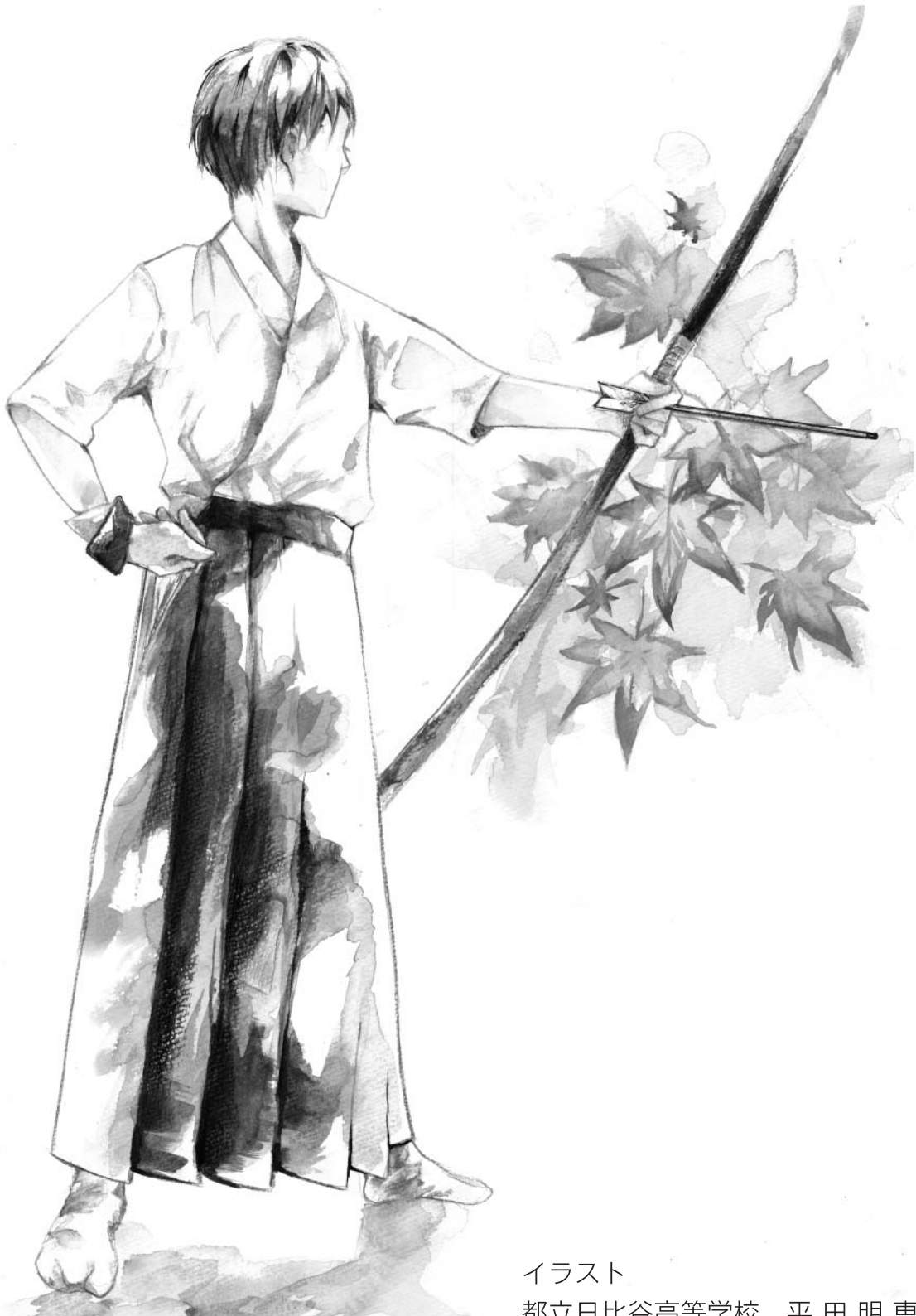
イラスト 都立日比谷高等学校 平田明恵