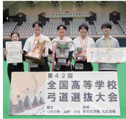
男子団体 優勝 山形県立山形中央高等学校