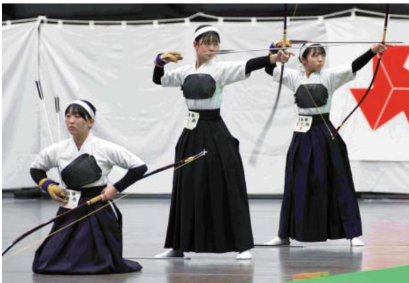
女子団体 第2位 鳥取県立倉吉西高等学校