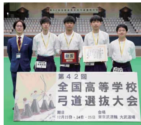
男子団体 技能優秀賞 慶應義塾高等学校