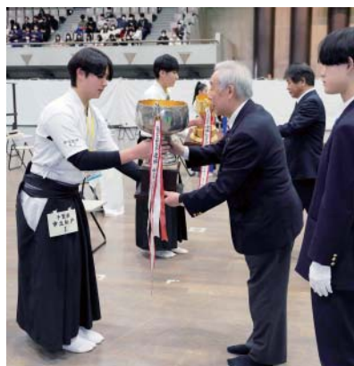
優勝杯返還 松戸市立松戸高等学校