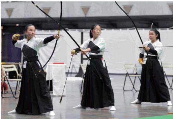
女子団体 優勝 技能優秀賞 岐阜県立各務野高等学校