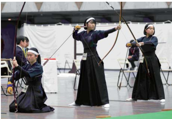
女子団体 第3位 千葉県立佐原高等学校