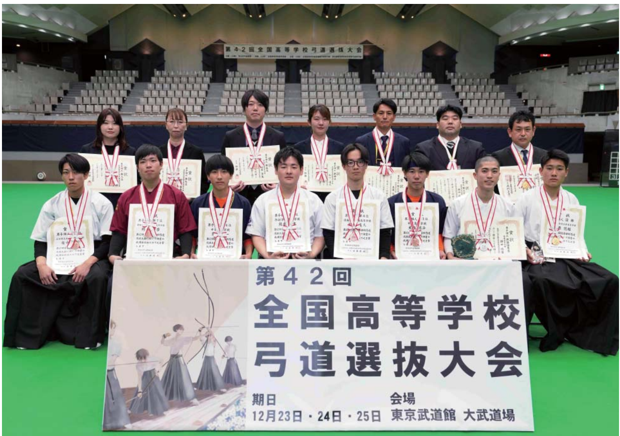
男子個人 入賞者 第8位 第7位 第6位 第5位 第4位 第3位 第2位 優勝