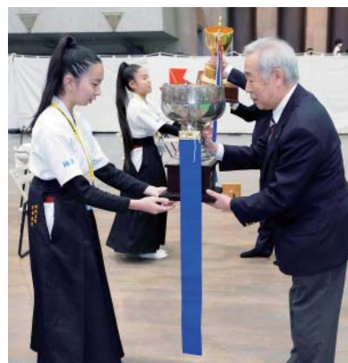
優勝杯返還 祐誠高等学校